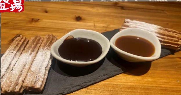
ディップチュロス 750円