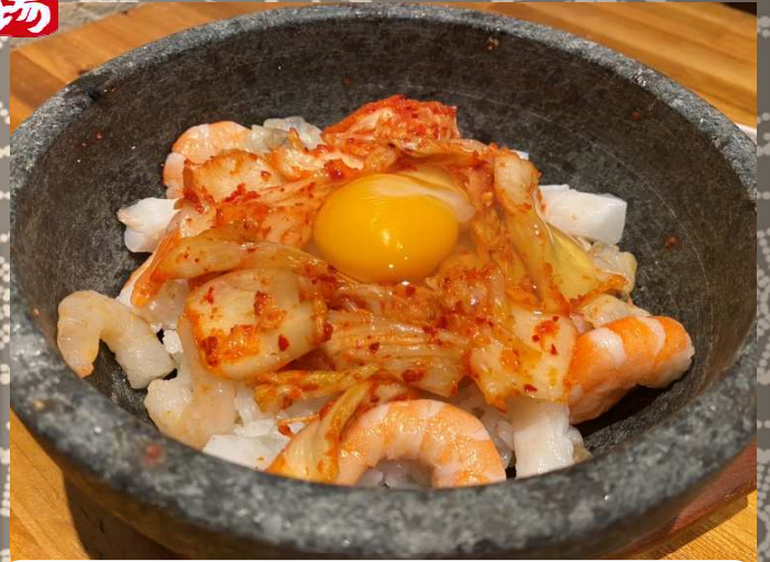
海鮮石焼びびンバ 880円