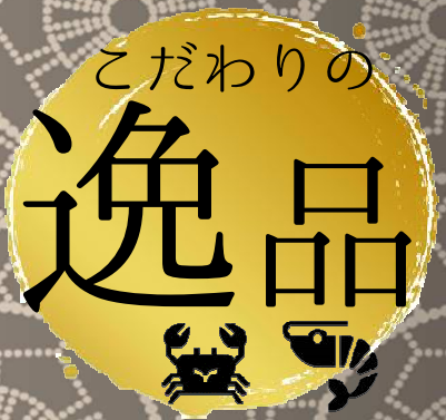
カニ味噌甲羅焼き 980円